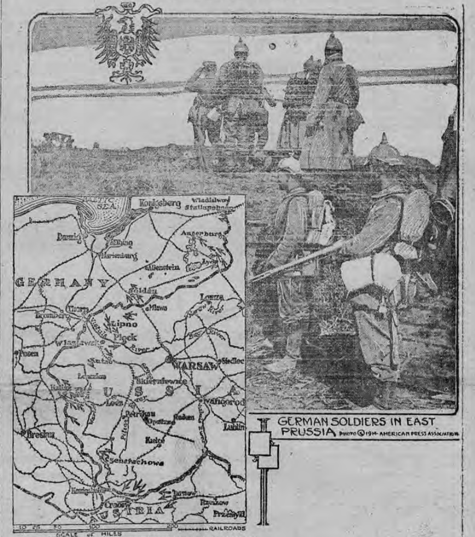
MAP SHOWING HOW GERMANY IS STRIKING BACK AT RUSSIA

En el grabado superior aparecen los soldados alemanes en la Prusia oriental y en el mapa inferior se indica la posición que ocupaban las líneas alemanas antes de que se llevara a cabo el ataque a Lodz, el cual, según los últimos cables, ha sido un éxito para los alemanes. Con esto tratan de devolver a los rusos el golpe que estos les habían dado anteriormente.